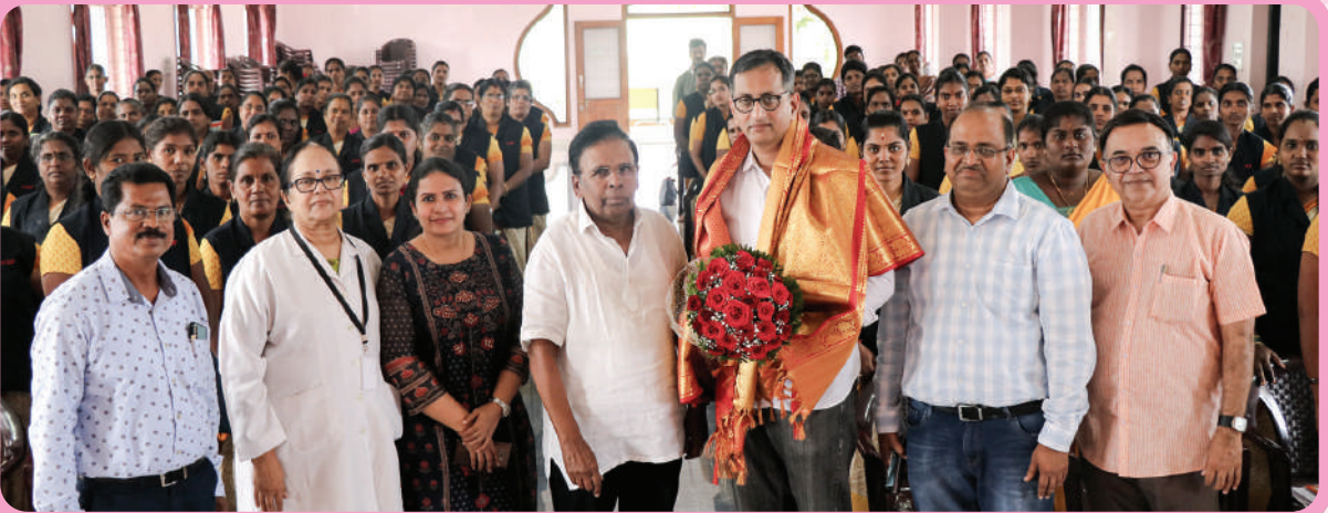
கார்கினோஸ் நிறுவனத்தின் தலைமை நிர்வாக அலுவலர் வருகை