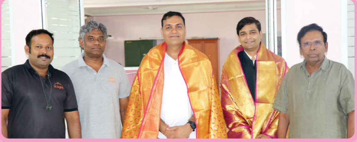
டிலைட் நிறுவன மேலாண்மை இயக்குநர் வருகை