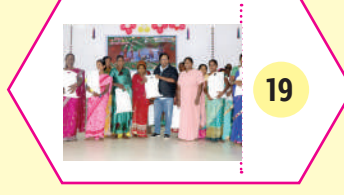
19 ஐவிடிபியின் சமூகப் பணிகள்