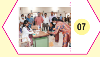
07 ஐவிடிபி பணியாளர்களுக்கு புற்றுநோய் விழிப்புணர்வு & பரிசோதனை முகாம்