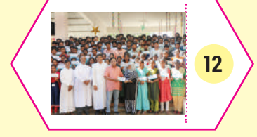
12 ஐவிடிபியின் கல்விப் பணிகள்