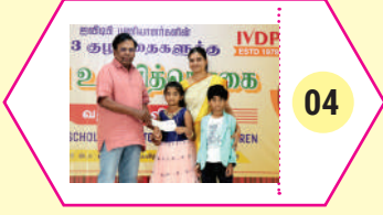
04 ஐவிடிபி பணியாளர் & விதவை உறுப்பினர்களின் குழந்தைகளுக்கான கல்வி உதவித் தொகை