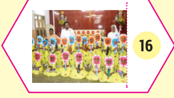
16 ஐவிடிபியின் கல்விச் சேவைகள்