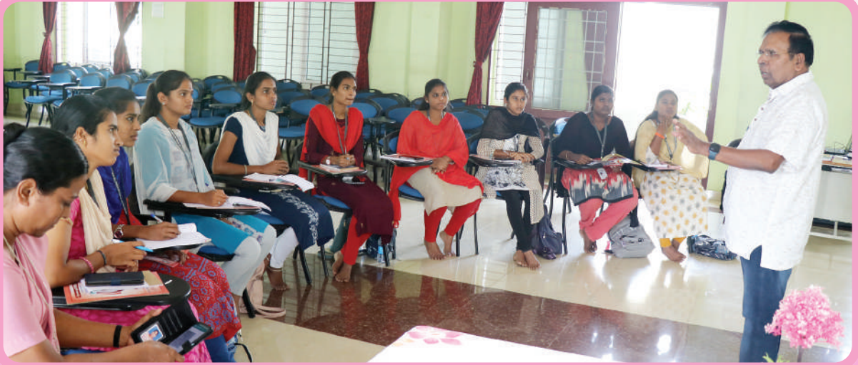
எலத்தகிரி, கொன்சாகா கலை மற்றும் அறிவியல் கல்லூரி சமூகப் பணித்துறை மாணவியரின் ஜ.வி.டி.பி நோக்கிய களப்பயணம்